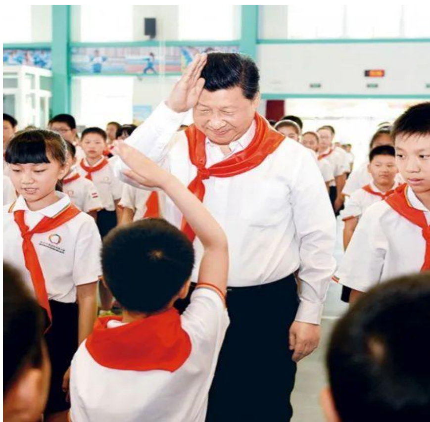
2014年5月30日，习近平来到北京市海淀区民族小学参加庆祝“六一”国际儿童节活动。这是习近平参加少先队入队仪式。