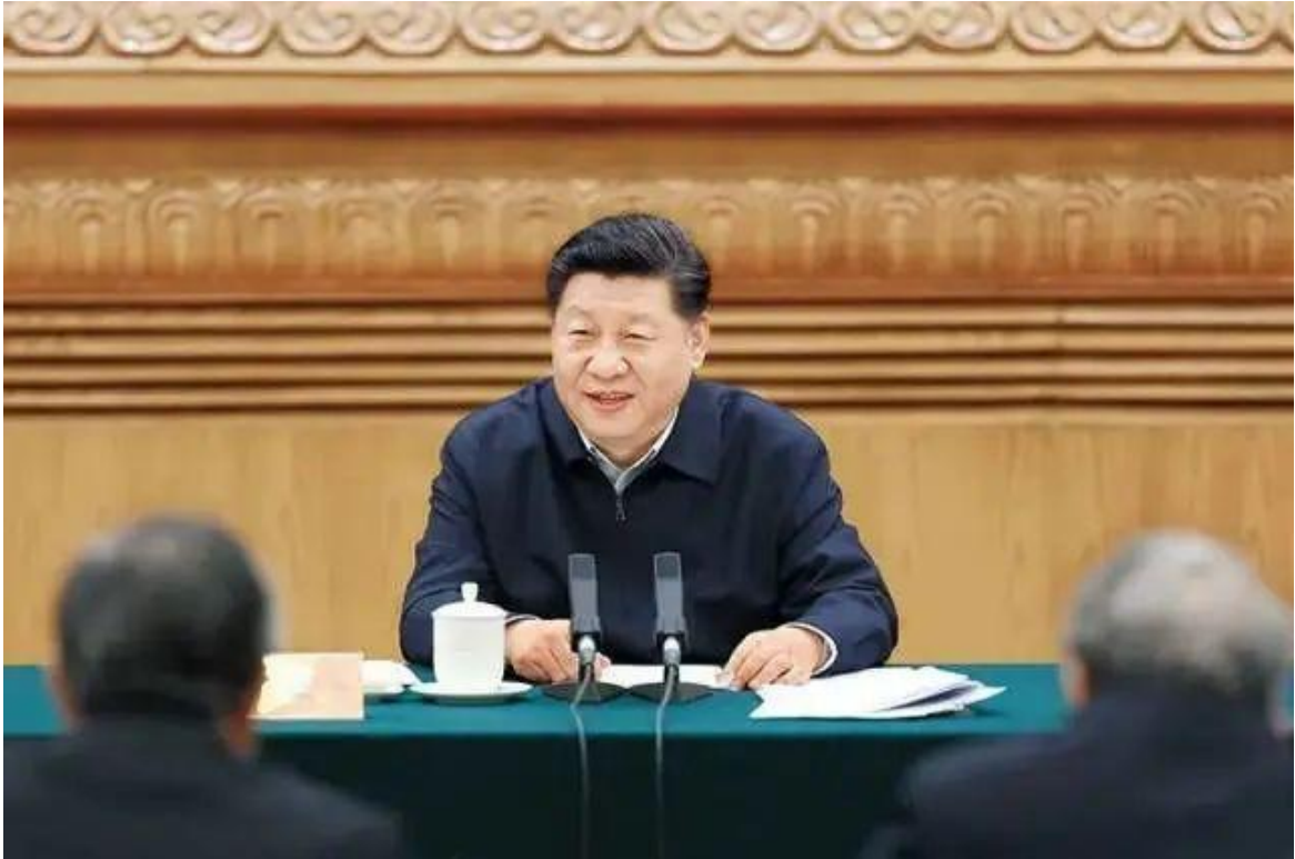
2019年3月18日，习近平在北京主持召开学校思想政治理论课教师座谈会并发表重要讲话。