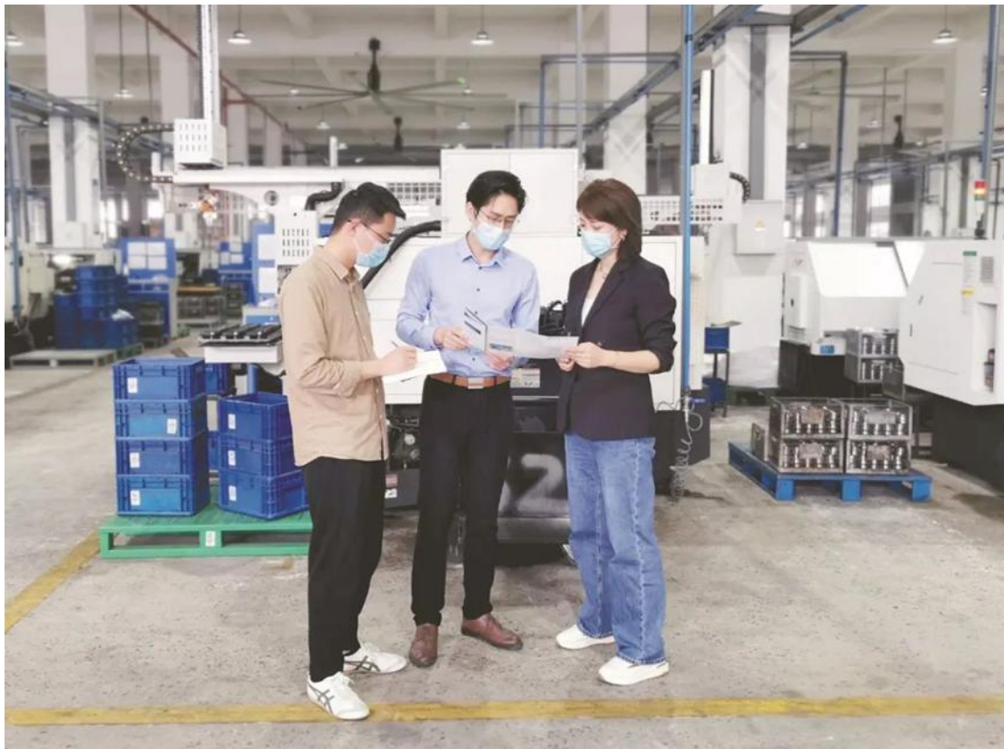
浙江省玉环市纪委监委近日在辖区内企业开展走访，并对全市退休干部违规到企业任职情况开展专项清理，推动构建亲清政商关系。图为该市纪委监委工作人员到某企业宣传规范政商交往有关内容。

浙江省玉环市纪委监委近日在辖区内企业开展走访，并对全市退休干部违规到企业任职情况开展专项清理，推动构建亲清政商关系。图为该市纪委监委工作人员到某企业宣传规范政商交往有关内容。